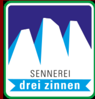
Schaukäserei Sennerei Drei Zinnen